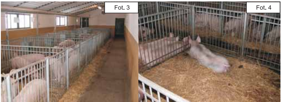
Fot. 3 i 4. Transgeniczne świny pokolenia F1.